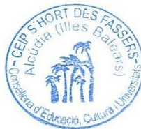
Ramon Àngel Quetgles Ramis